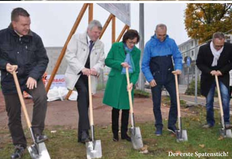
Der erste Spatenstich!