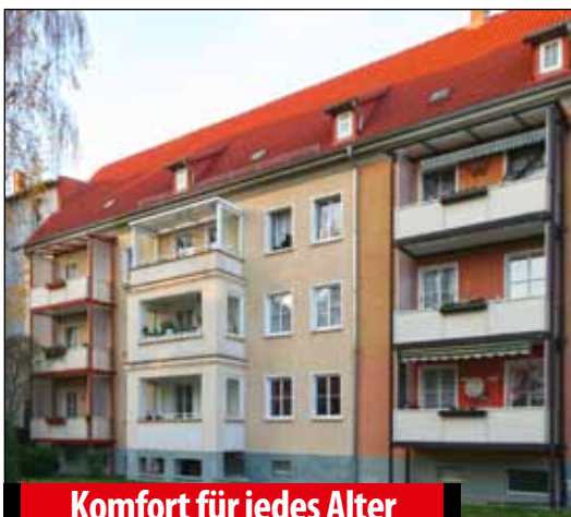
Komfort für jedes Alter

Ausstattung: schön geschnittene Wohnung mit farbig gefliestem Tageslichtbad mit bodengleicher Dusche, moderne Bodenbeläge, helle großzügige Wohnräume Lage: Oberstadt, ruhiges, innenstadtnahes Wohngebiet mit großen grünen Innenhöfen unweit vom Zentrum, gute Parkmöglichkeiten im Umfeld