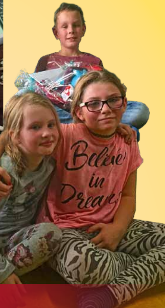
200. Buchung des Geburtstagszimmers Fußball