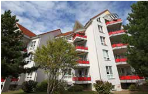
Kirchfeldring / Gemm- straße